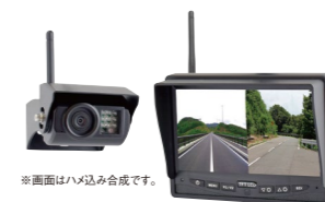
無線バックカメラ BK-NK ※BK-12がないと取付出来ません。