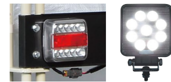
ウインカー II (NK) KW-N200