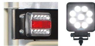
ウインカー II (DN) KW-D200