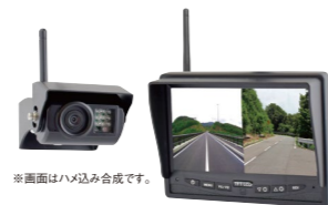
無線バックカメラ BK-DN ※BK-11がないと取付出来ません。